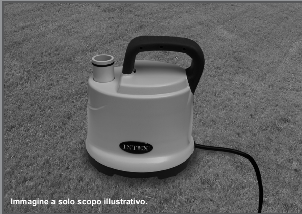
Immagine a solo scopo illustrativo.

Non dimenticate di acquistare anche gli altri prodotti Intex: Le Piscine fuori terra, gli Accessori per piscine, le Piscine gonfiabili, I Prodotti In-Toyz, i Materassi gonfiabili Airbed e i Canotti sono prodotti Intex disponibili presso i rivenditori oppure visitando il sito Internet.