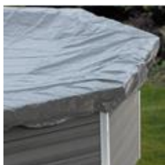
Couvertures pour l'hiver Copertura invernale CIKPCO41