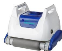
Robot Robot RKA80