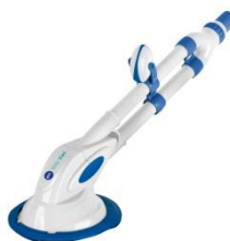
Limpiafondos automático Automatic cleaner 90399