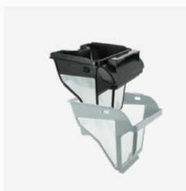
Vasca filtrante Filtro a due stadi: 150/60 µ