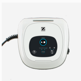
Scatola di comando